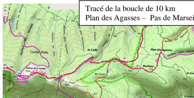
Tracé de la boucle de 10 km Plan des Agasses – Pas de Marseille